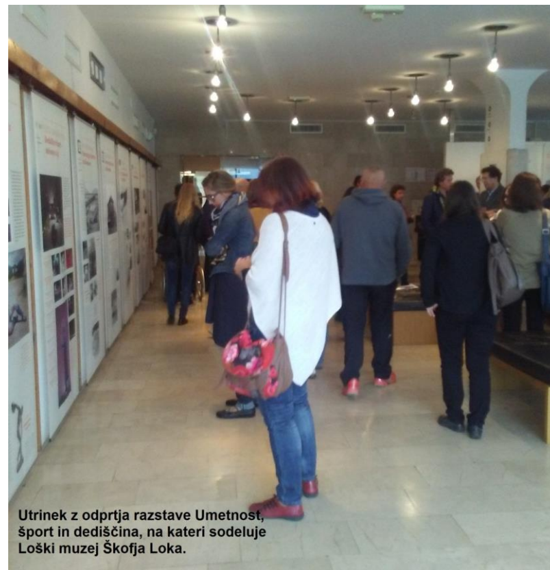
Utrinek z odprtja razstave Umetnost, šport in dediščina, na kateri sodeluje Loški muzej Škofja Loka.