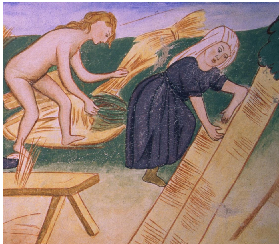
Prizor s freske Svete Nedelje, Crngrob

Kadar so imeli terice pri hiši, je bila vedno boljša, izdatnejša hrana. Takrat so gospodinje kar tekmovaly med seboj, katera se bo bolj izkazala, saj so vedele,