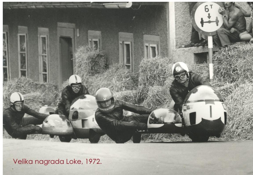
Velika nagrada Loke, 1972.