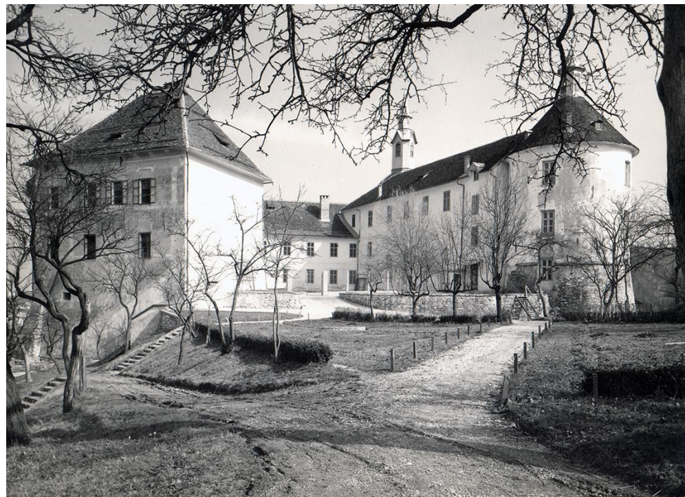
Loški grad po 2. Svetovni vojni.