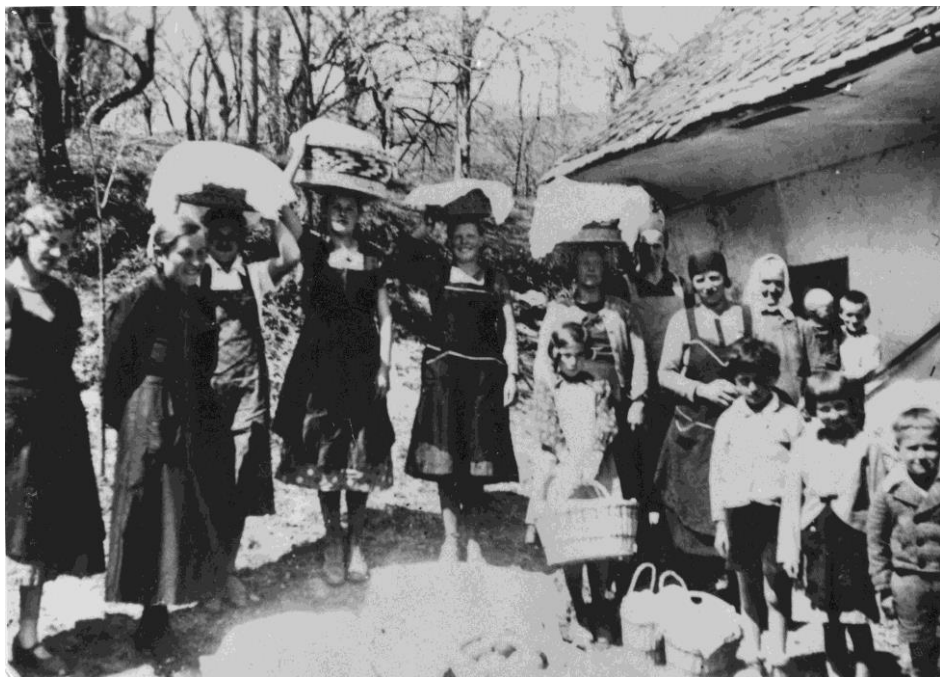
Dekleta iz Brda nesejo žegen v cerkev sv. Križa nad Srednjo vasjo v Poljanski dolini, 1932.

Velika noč je največji in najstarejši krščanski praznik. Na veliko noč se kristjani spominjajo Kristusovega vstajenja. Velika noč je določena po judovskem - luninem koledarju vedno na prvo nedeljo po prvi spomladanski polni luni. Resne priprave na praznovanje se pričnejo po cvetni nedelji, ko se spominjamo prihoda Kristusa v Jeruzalem.