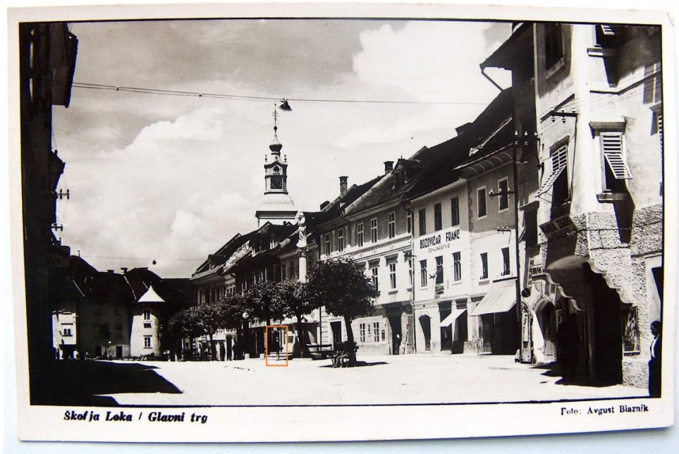
Bencinska črpalka pred Deisingerjevo trgovino, p. d. pri Sorž , pred letom 1940.