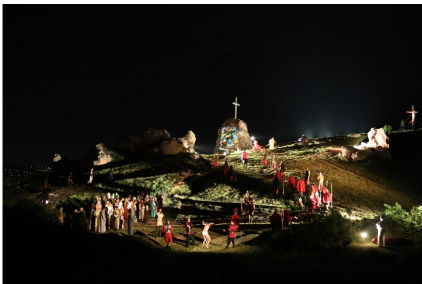
Nočna pasijonska predstava na kamnitem hribu Kőhegy