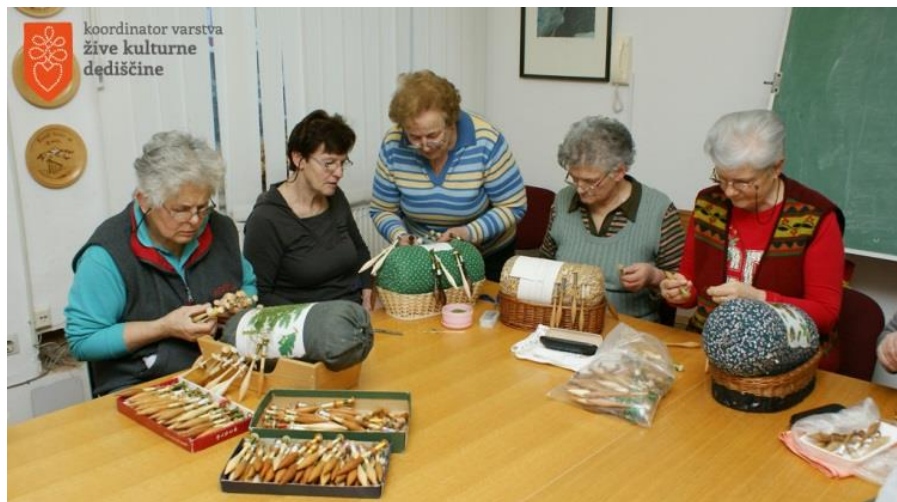
Klekljarsko društvo Cvetke Žiri.