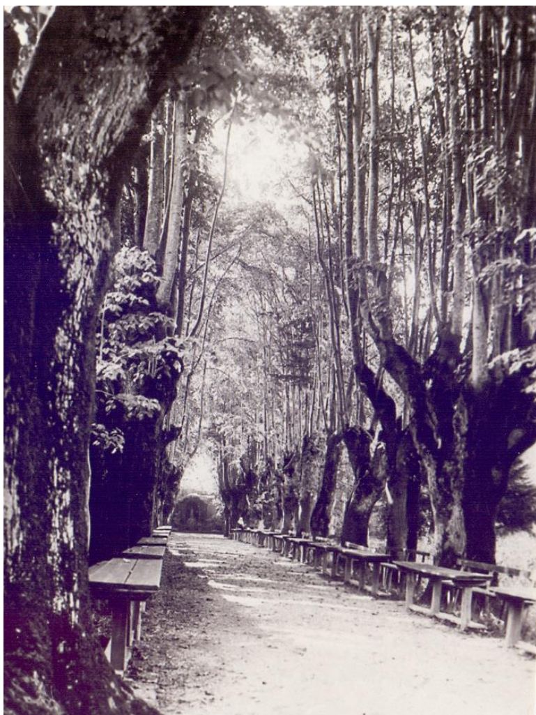
Grajske lipe.

Drevesa so bila obravnavana na podlagi njihovega stanja v času terenskega dela, opravljenih analiz, preverjanja dostopnih historičnih virov, problematike odstranjevanja velikih dreves z vidika nastanka novih ravninskih razmer in vpliva na stabilnost ter morebitnih gradbenih del. Na podlagi več dejavnikov se je podala ocena pričakovanega razvoja dreves ter nekaj izhodišč za usklajevanje interesov vseh pristojnih ustanov ter iskanje najboljših rešitev za vzdrževanje ter morebitne nadomestne saditve.