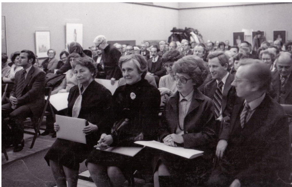
Svečanost ob podelitvi Valvasorjeve nagrade za leto 1979, Galerija na Gradu, 1980.