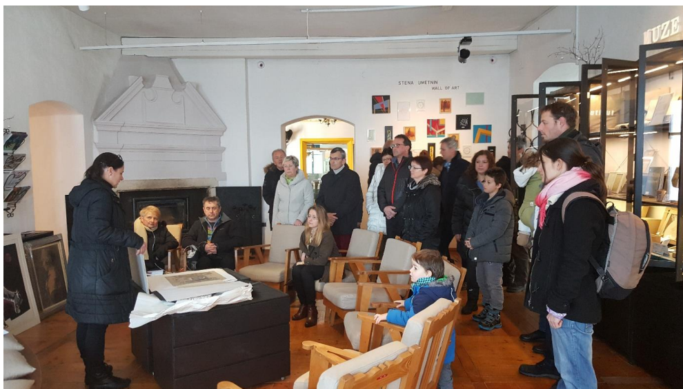
Foto: Zgodbe iz depojev, predstavitev predmetov, ki jih Loški muzej hrani v depojih, 8. februar 2018.