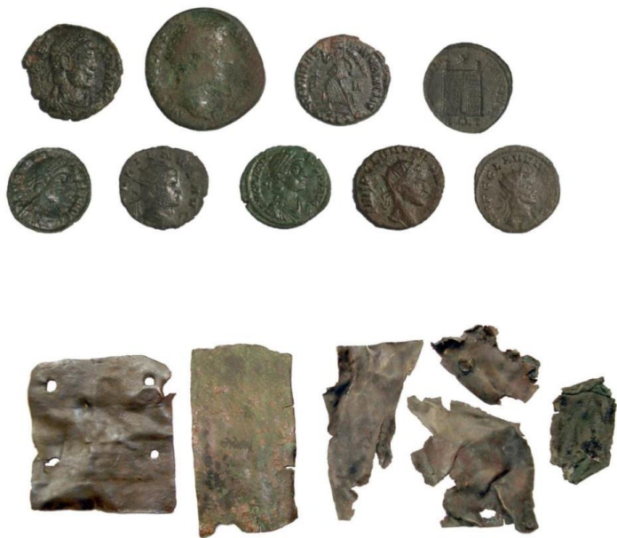
Rimskodobni predmeti iz jame pod Plavo skalo.