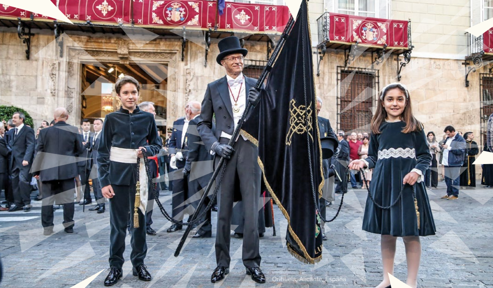
Orihuela, Alicante, España