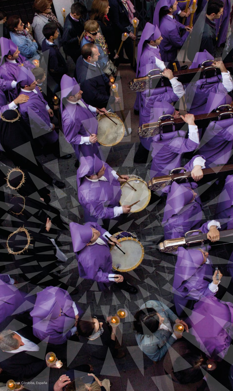
Lucena, Córdoba, España

En Europa, la Semana Santa y la Pascua se celebran con gran tradición e intensidad. Estas celebraciones de carácter religioso, tienen en algunos casos, raíces ancestrales.