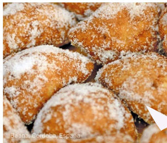
Baena, Córdoba, España

Una de las celebraciones más originales, reconocida por la UNESCO, tiene lugar en la pequeña localidad de Škofja Loka, en Eslovenia , donde se recrea una escena secular de la Pasión de Cristo en las calles y cuenta con la participación de toda la comunidad.