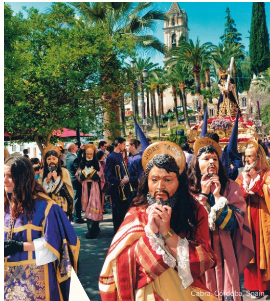
Cabra, Córdoba, Spain

Around these places, religious corporations were born (brotherhoods and sisterhoods), which were responsible for organising devotional manifestations that have evolved over time, and that take on a larger dimension during Lent and the Holy Week. For this very reason, it is possible to observe a geographical area where a number of cultural manifestations coexist in Europe: a diversity of ways for communities to experience the traditions of the Holy Week and Easter.