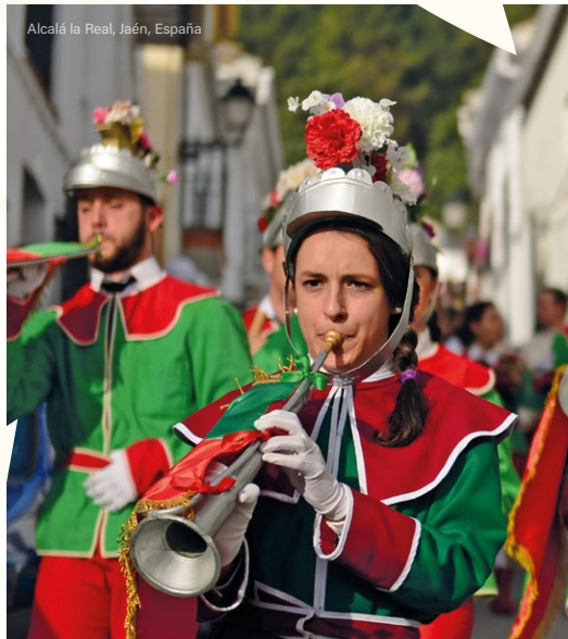
Alcalá la Real, Jaén, España

Alrededor de estos lugares fueron apareciendo corporaciones religiosas (cofradías y hermandades) que se hicieron responsables de la realización de manifestaciones de devoción y que fueron evolucionando a lo largo del tiempo, alcanzando su máxima expresión durante la Cuaresma y Semana Santa. Es, por esta razón, por la que se puede ver en Europa un espacio geográfico en el que conviven variadas manifestaciones culturales: maneras distintas que tienen las comunidades de vivir las tradiciones de Semana Santa y Pascua.