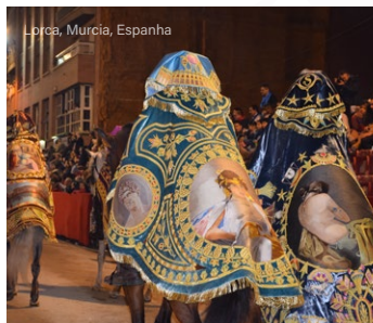
Lorca, Murcia, España

Y, ¿cómo olvidar la ciudad de Braga ( Portugal ), sede de la principal archidiócesis portuguesa y de un ritual litúrgico singular, en donde la Semana Santa se vuelve la principal manifestación del género en este país?