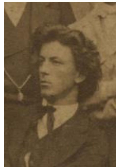
Foto: Ivan Tavčar kot visokošolec

Hrani Zgodovinski arhiv Ljubljana – Enota v Škofji Loki.