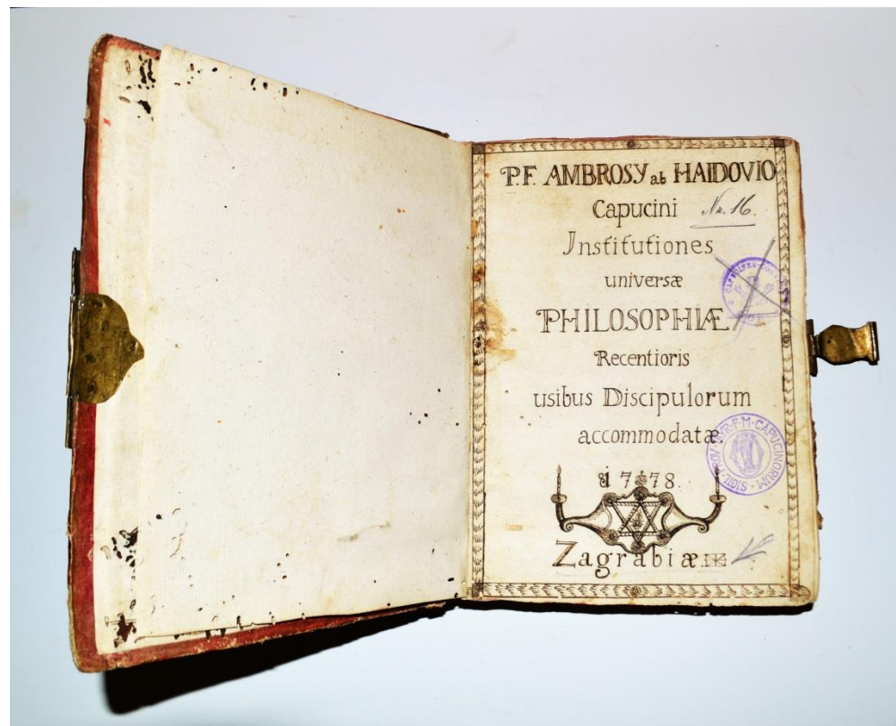
Foto: knjiga z žigom celjskega in goriškega kapucinskega samostana