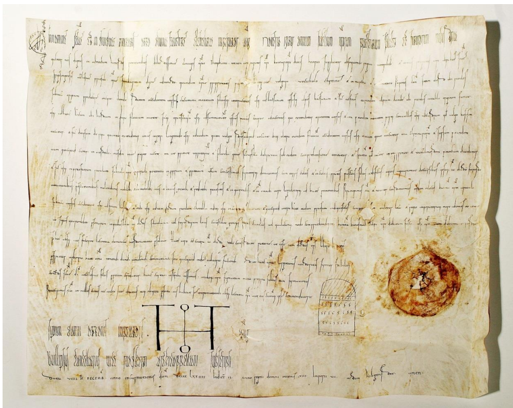
Foto: darilna listina