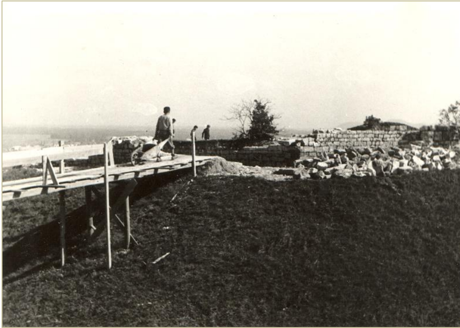
Foto: Delo na Kranclju, 1954.